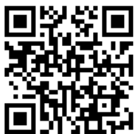
Марафон безопасности ЮИД