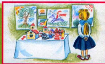
Выставка детских поделок