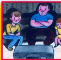
Видеофильмы, кинофильмы, аудиозаписи