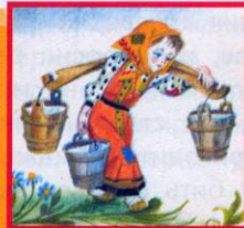
Сказки народов России