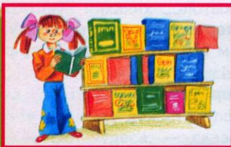
Выставки книг по разным темам