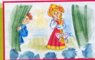
Конкурс знатоков народных сказок, песен, загадок, поговорок