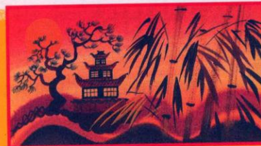
Сказки народов мира