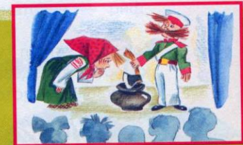
Инсценировка сказок и песен