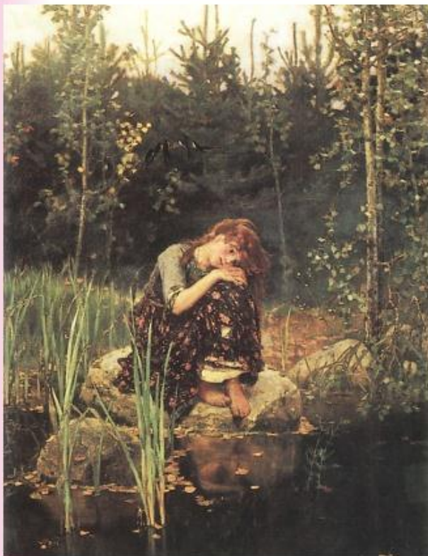
В.М. Васнецов Лёнушка