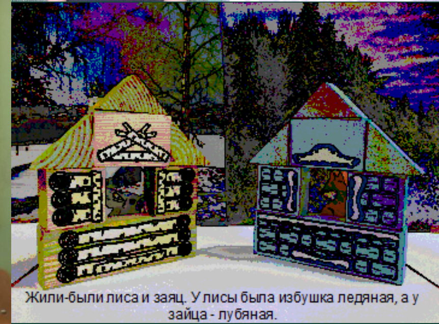
Жили-были лиса и заяц. У лисы была избушка ледяная, а у зайца - лубяная.