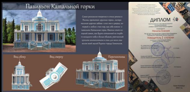
«СИМВОЛ ПАМЯТИ МОЕЙ МАЛОЙ РОДИНЫ»