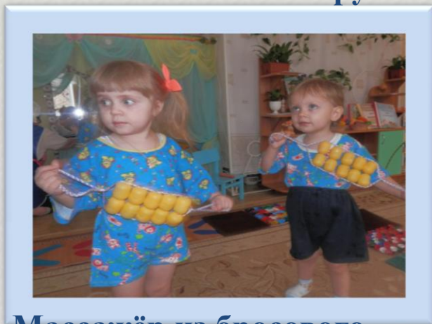
Массажёр из бросового материала