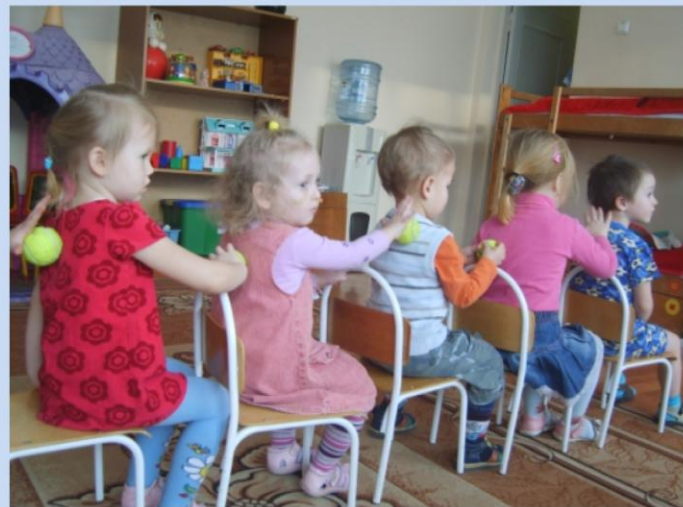
Массаж в колонне или кругу