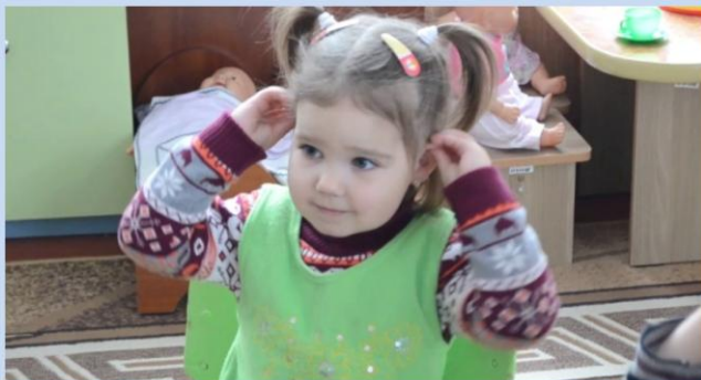
Массаж ушных раковин