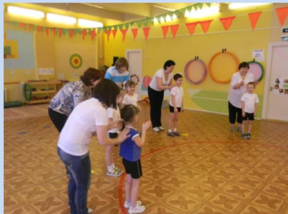
Массаж в парах