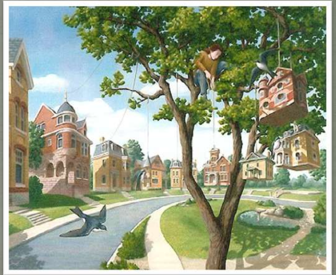
Rob Gonsalves "For the Birds" Роб Гонсалвес «Для птиц»