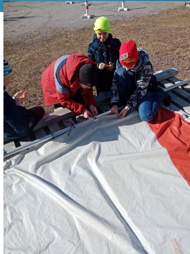
Тренировка по привязыванию паруса от швертбота «Оптимист»