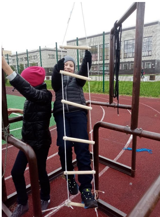
Самостоятельный сбор веревочной лестницы