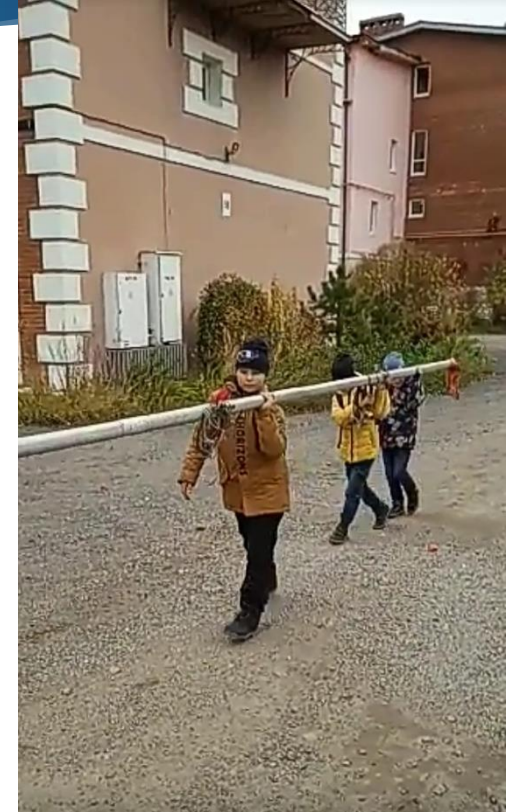
Транспортировка мачты к месту зимнего хранения