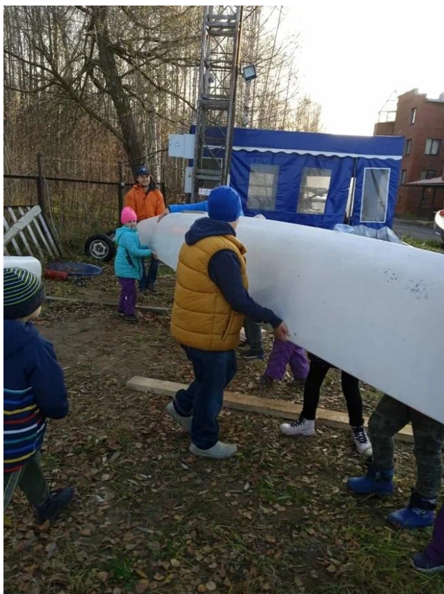
Подготовка к зимнему хранению