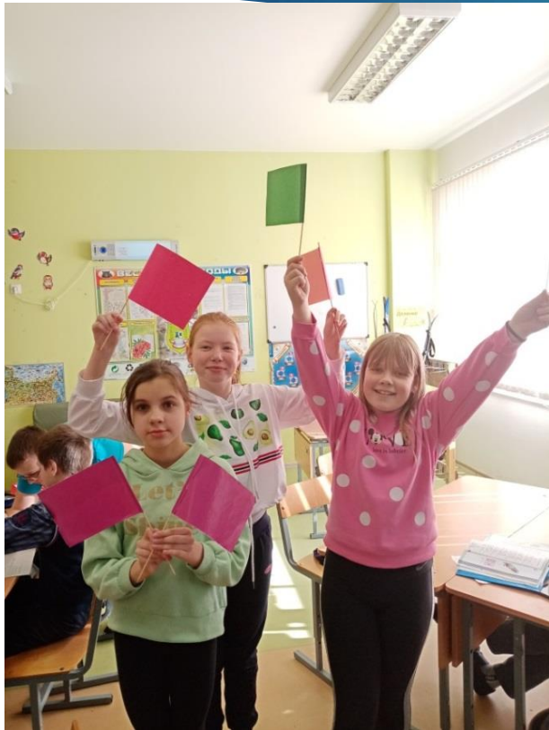
Изучение флажного семафор